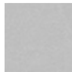
Light grey (Y506)